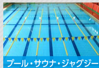
プール・サウナ・ジャグジー