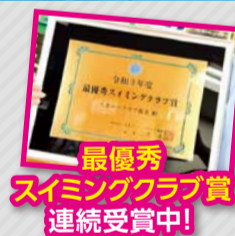
最優秀 スイミングクラブ賞 連続受賞中!