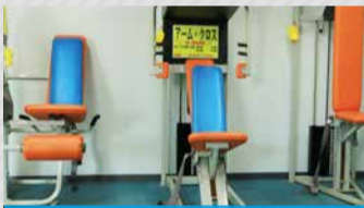
ノーチャスマシン